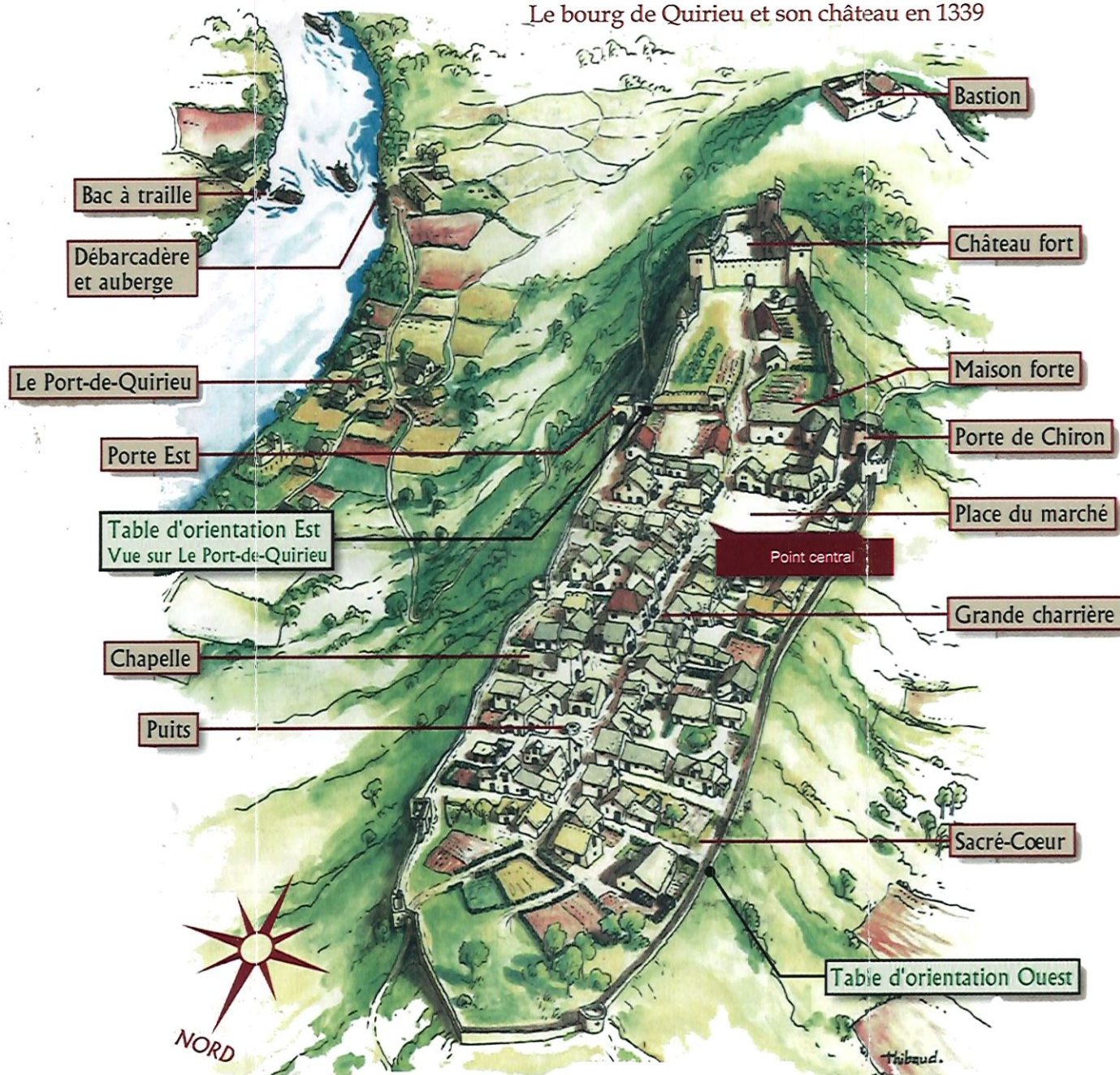
Le bourg de Quirieu et son château en 1339

Le site est aujourd'hui totalement inhabité. Un des particularismes de la ville de Quirieu est d'avoir été bâtie, en hauteur, sur une plate-forme qui offre une altitude constante de 300 mètres. Le site occupe entièrement le sommet du plateau, soit un peu plus de 4 ha. Il est délimité par une enceinte. Celle-ci prolonge, en les accentuant, les bords abrupts et escarpés du plateau.