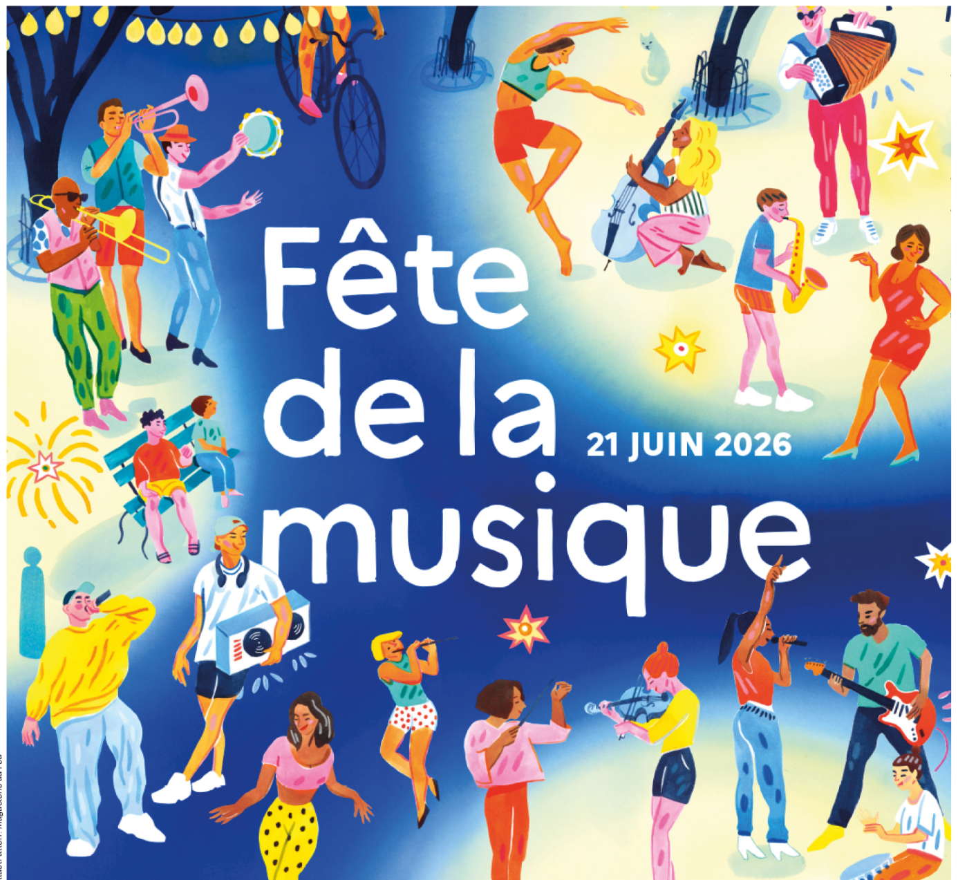
Illustration: Maguelaine du Fou

www.balconsdudauphine-tourisme.com #BalconsduDauphiné